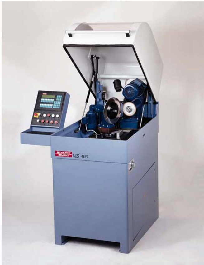
Zum vollautomatischen Schleifen von 1 oder 2 Fasen, ein- oder zweiseitig (je nach Ausstattung)